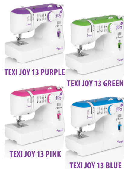
TEXI JOY 13 PURPLE